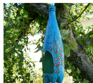
Photos du jardin du Subdray