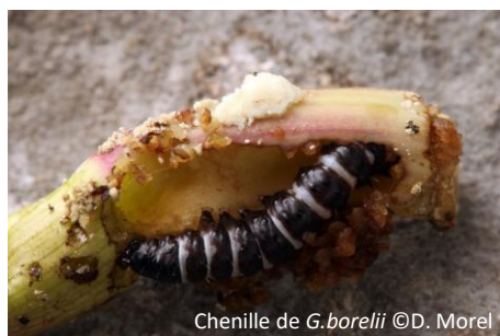
Chenille de G. borelii