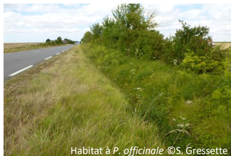
Habitat à P. officinale

Le Drap d'or ( Gortyna flavago ) peut s'en approcher, mais G. borelii a une taille plus grande, une teinte générale plus « froide » et une ligne submarginale double.