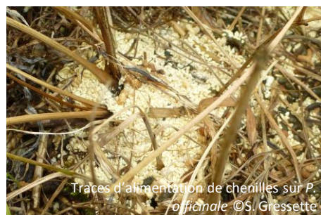
Traces d'alimentation de chenilles sur P. officinale