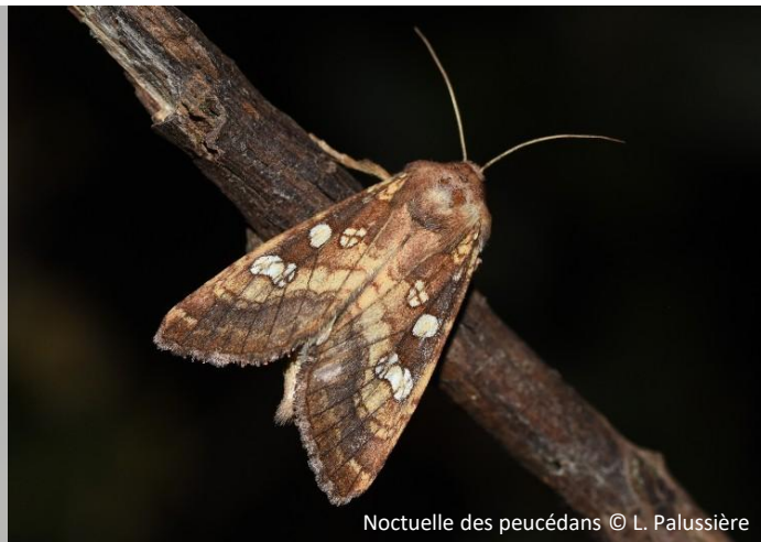
Noctuelle des peucédans

On le repère surtout grâce aux traces d'alimentation des chenilles, ou en observant les adultes à la lampe frontale.