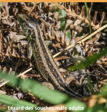
Lézard des souches mâle adulte

C'est la couverture régionale de la répartition du Lézard des souches depuis 2002. Cela correspond à 95 mailles atlas de 5 km de côté.