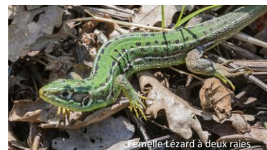
Femelle Lézard à deux raies