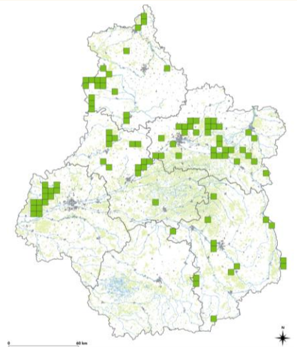
Observations du Lézard des souches en région depuis 2002

C'est le reptile qui a le plus régressé en région. En effet, sa répartition a diminué d'environ 60 % en 50 ans et l'espèce n'est plus signalée depuis 2012 que dans 61 mailles atlas de 5 km (soit 3,5 % du territoire régional). Une des preuves les plus visibles de cette régression est que ce lézard n'a plus été signalé dans l'Indre depuis 2000.