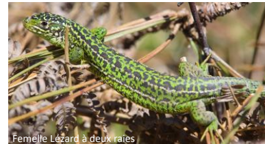
Femelle Lézard à deux raies