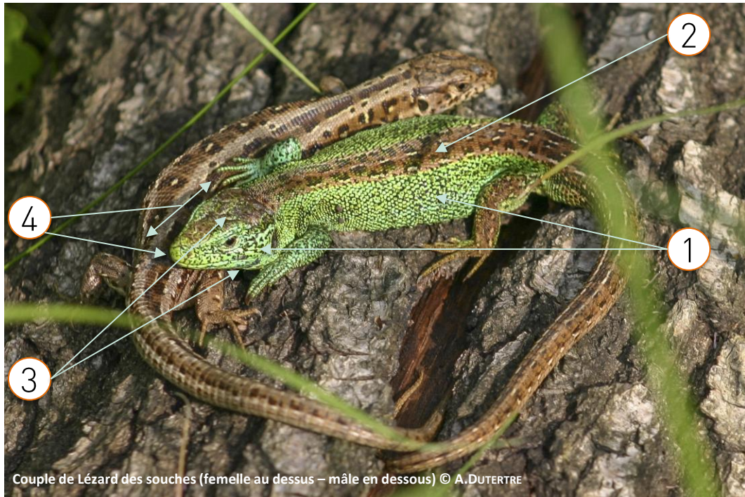
Couple de Lézard des souches (femelle au dessus – mâle en dessous)