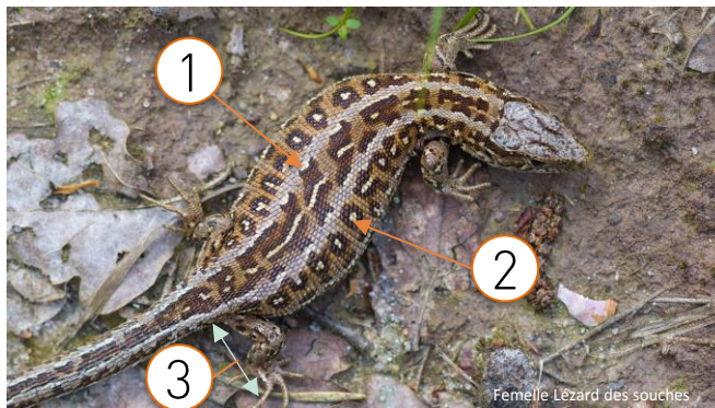
Femelle Lézard des souches

La confusion la plus fréquente a lieu entre la femelle Lézard des souches (ci-dessous) et la femelle Lézard à deux raies (voir les trois photos de droite). Chez la femelle Lézard des souches, la gorge est toujours brune ou crème alors qu'elle est toujours verte (tirant parfois sur le jaune) chez le Lézard à deux raies femelle. Par ailleurs, les lignes dorso-latérales sont larges et crèmes chez le Lézard des souches alors qu'elles sont fines et blanches chez le Lézard à deux raies.