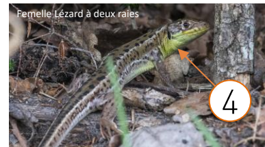
Femelle Lézard à deux raies