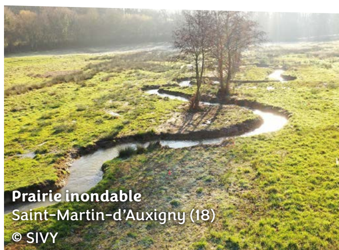
Prairie inondable Saint-Martin-d'Auxigny (18)