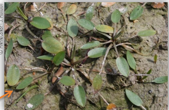
Forme terrestre du Flûteau nageant