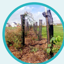
Plantation de haies