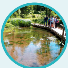
Sensibilisation des habitants, agriculteurs, entreprises