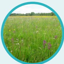
Restauration de milieux naturels (prairies, mares, etc.)