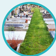
Végétalisation des cimetières