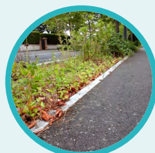
Gestion de l'eau pluviale