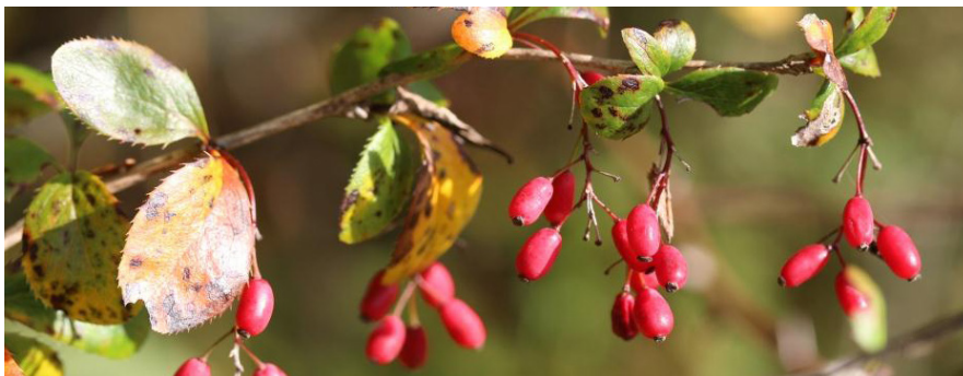
R. Dupré, MNHN-CBNBP

Au travers de témoignages d'aménageurs et de structures accompagnatrices, de visites de terrain, mais également de présentations d'outils pratiques, les participants pourront mieux appréhender les enjeux de la filière et ainsi mieux y contribuer.