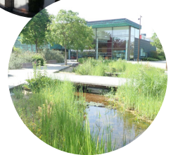
Gestion intégrée des eaux pluviales