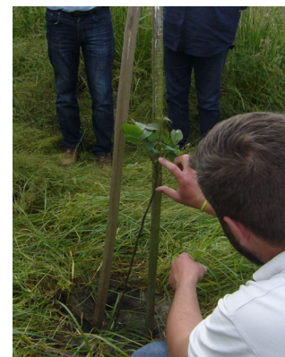
Visite des plantations de la première année