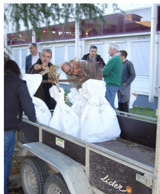
Livraison des plants

Des visites de plantations de la première année ont eu lieu en 2016, regroupant les élus du territoire. Cette sortie sera renouvelée en 2017.