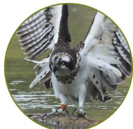
Balbuzard pêcheur