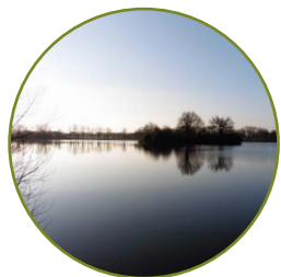
RNR Terres et étangs de Brenne Massé-Foucault