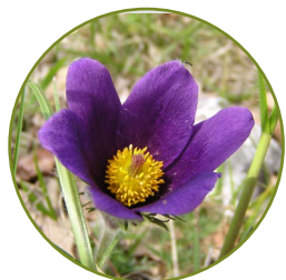
Anémone pulsatille, Vallée des Cailles