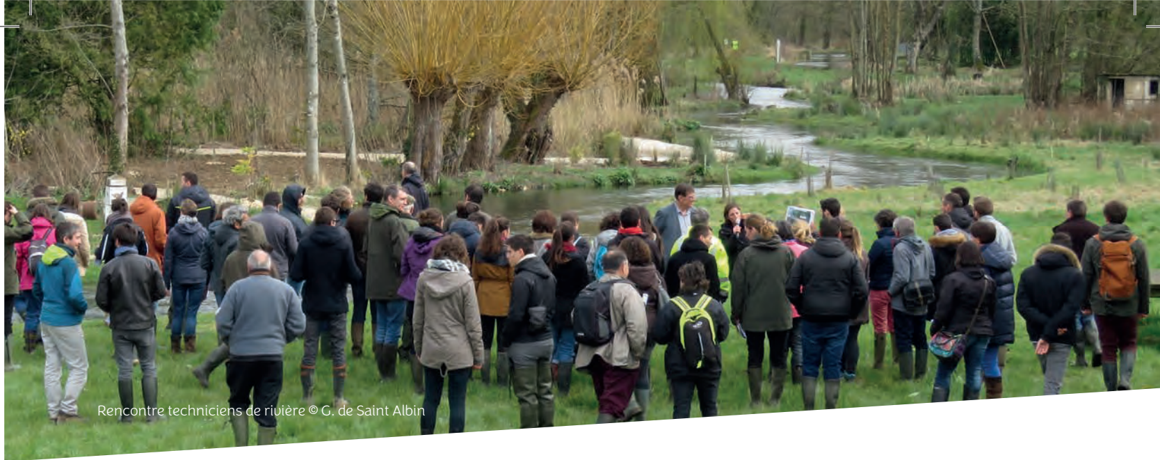
Rencontre techniciens de rivière