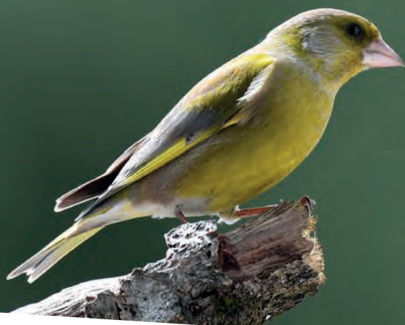
Verdier d'Europe