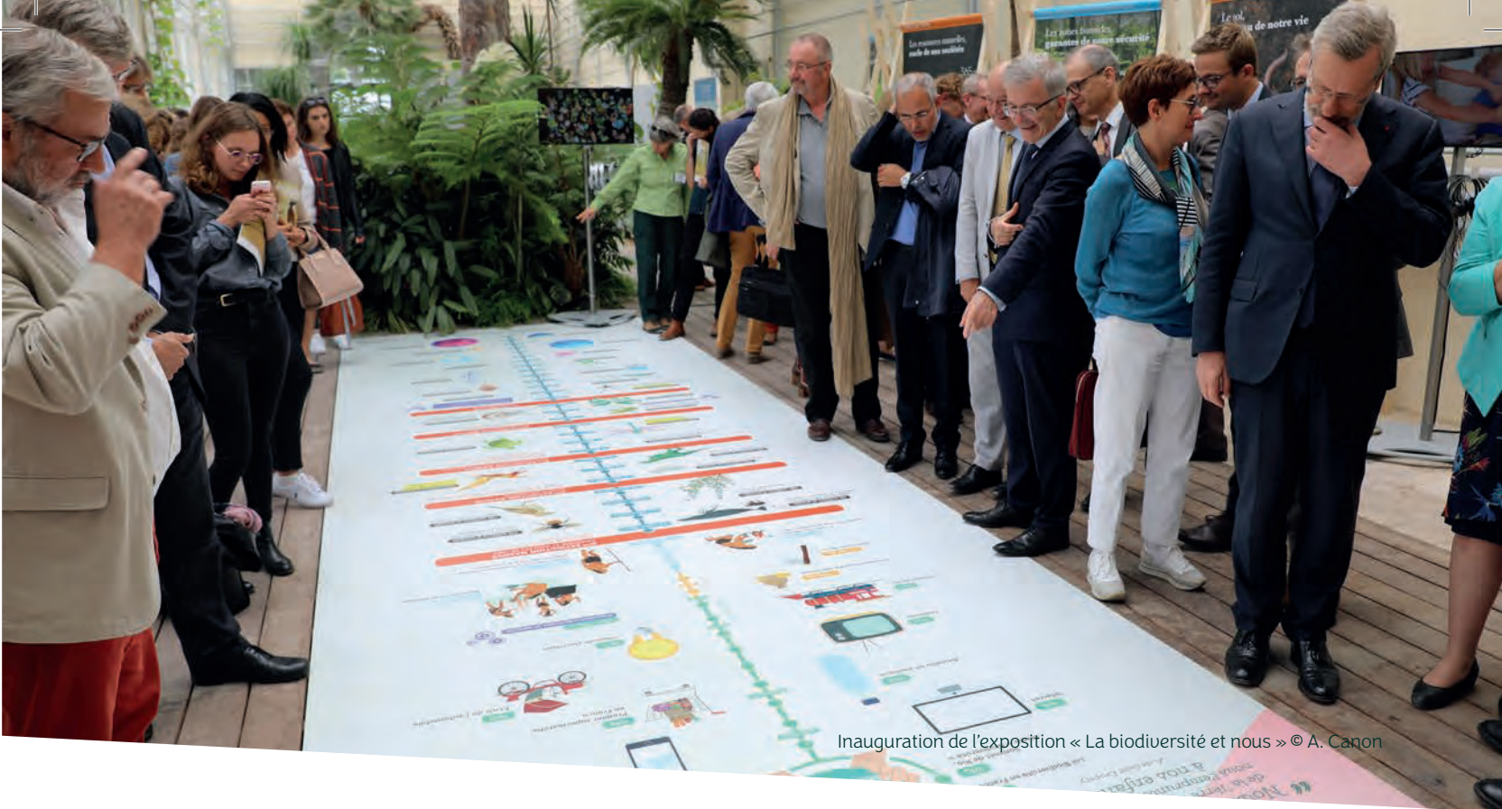
Inauguration de l'exposition « La biodiversité et nous »