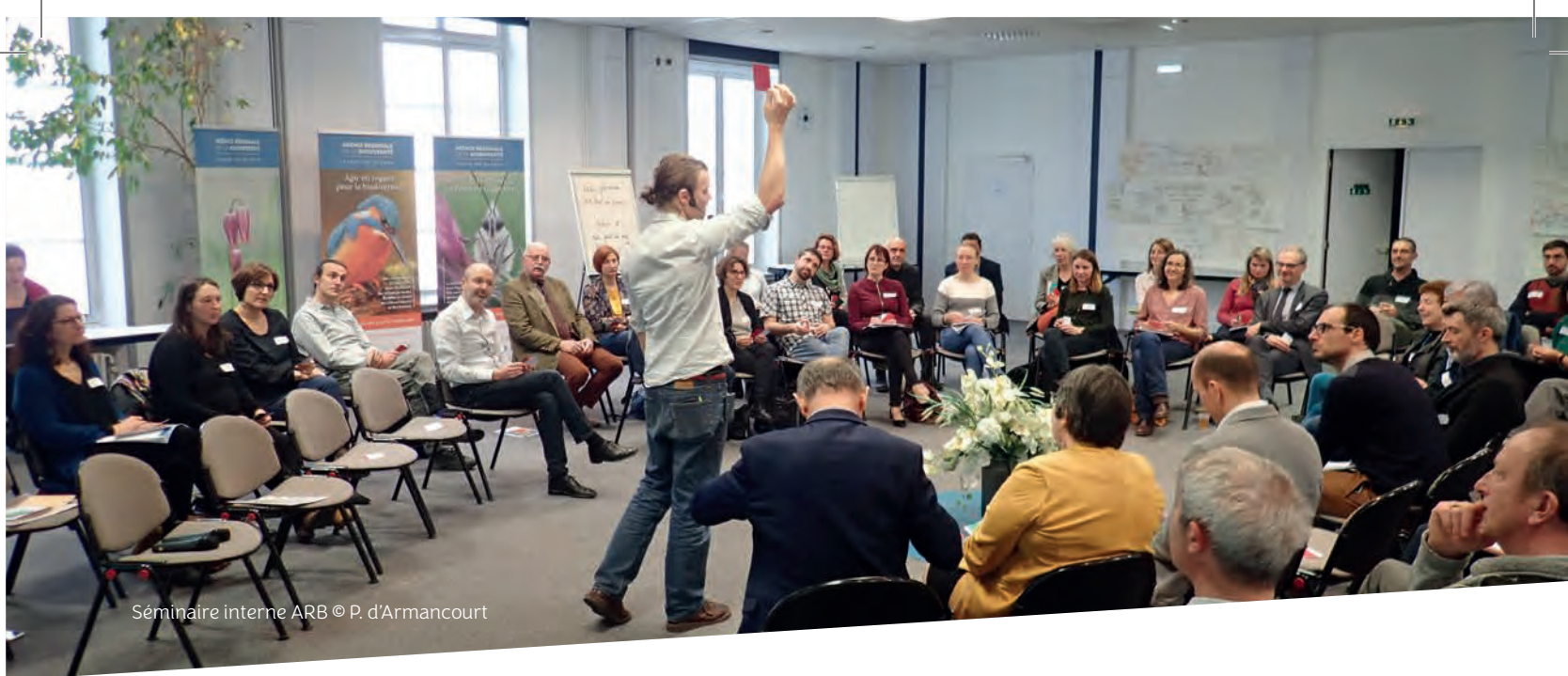
Séminaire interne ARB